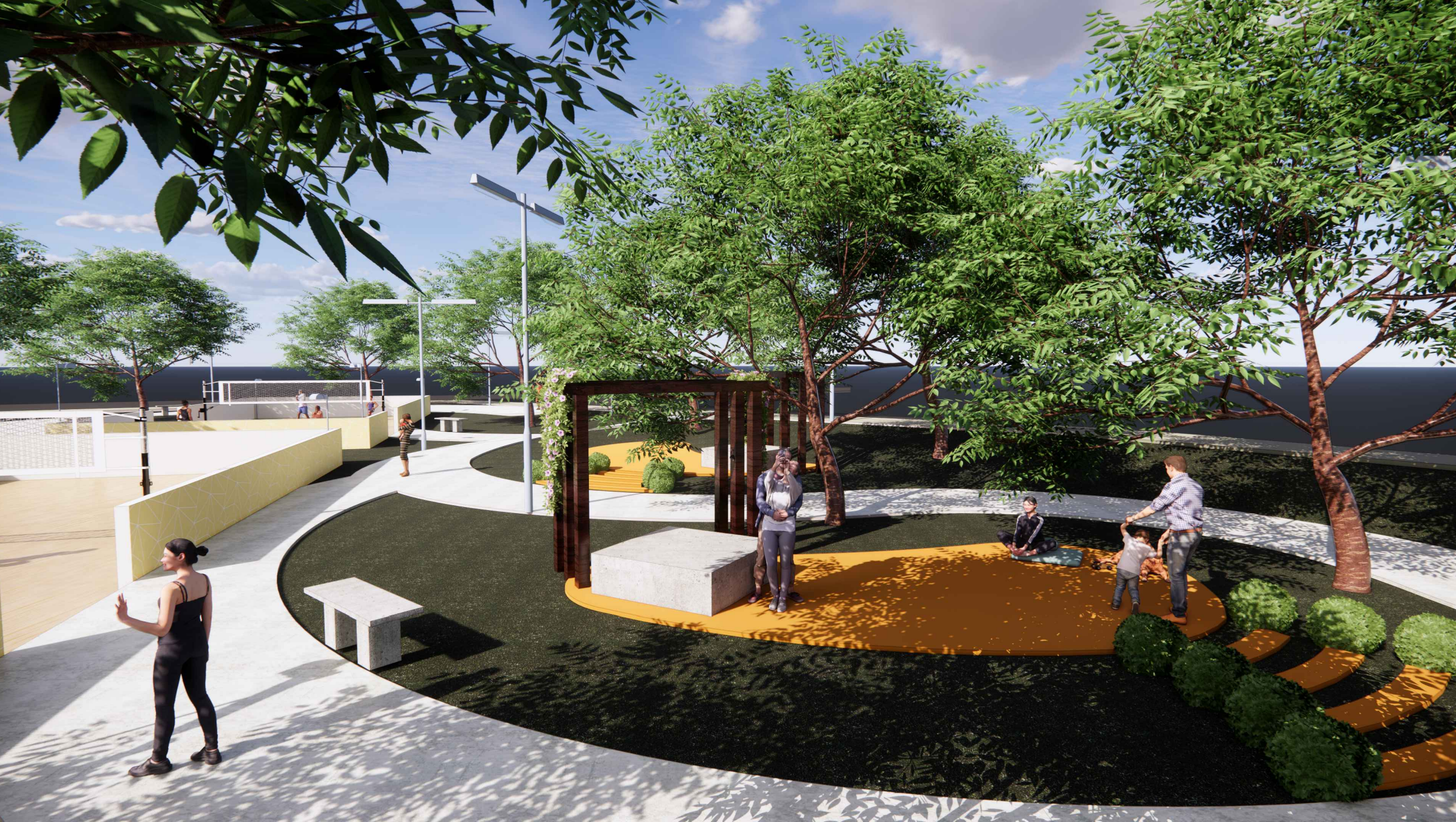
Represa da bica Sem escala